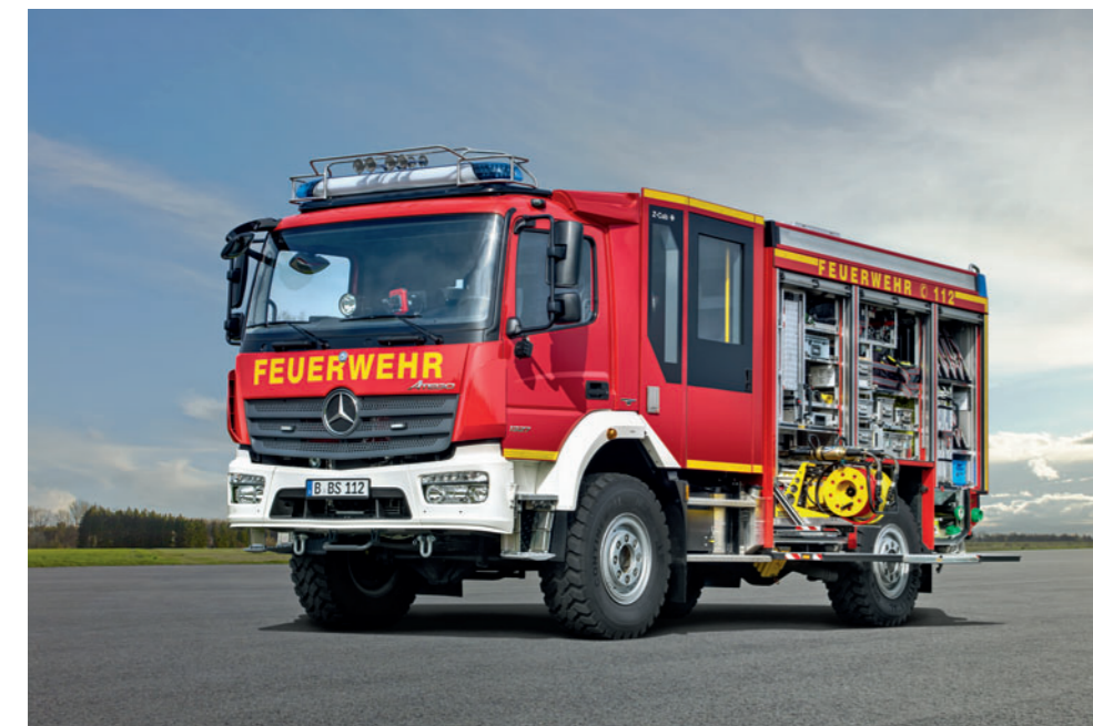
Atego 1327 AF 4x4, HLF 10

Gebaut für Einsätze am Limit. Und darüber hinaus. Die Variabilität und Robustheit der Atego Fahrgestelle bildet die perfekte Grundlage für den Einsatz als (H)LF. Auch das neu erhältliche Fahrprogramm Fire-Service wurde speziell für solche Einsätze entwickelt und unterstützt sowohl die Beschleunigung als auch die Dynamik des Fahrzeugs durch Verschiebung der Schaltpunktwahl. So wird die Motorleistung optimal ausgeschöpft und der