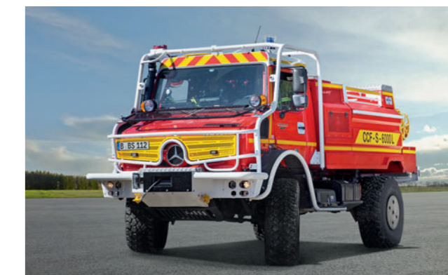
Der Unimog für besondere Einsatzzwecke