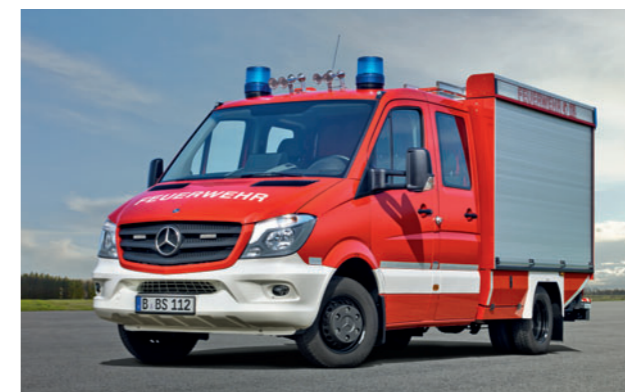
Der Sprinter als TSF

Volle Zugstärke. Auch beim Angebot. Als einziger Hersteller bietet Mercedes-Benz die komplette Produktbandbreite aus allen Sparten für den Feuerwehreinsatz an. Neben dem umfangreichen LKW-Angebot stehen auch spezialisierte PKW und Transporter für den Einsatz zur Verfügung. Umgerüstete Mercedes-Benz PKW sind die ideale Lösung für den Einsatz als NEF oder Kommandowagen. Maßgeschneiderte Einbauten und ihr ergonomisches Design sorgen gemeinsam mit der hohen Leistung dafür, dass Einsatzkräfte schneller dort sind, wo man sie braucht. Je nach Einsatzzweck steht – von der C-Klasse bis zur M-Klasse – das passende Basisfahrzeug zur Verfügung. Leichte Einsatzfahrzeuge für unterschiedliche Zwecke lassen sich optimal auf Basis der Mercedes-Benz Transportermodelle realisieren. Sprinter, Vito und Citan eignen sich zum Beispiel für Umbauten als ELW, Tragkraftspritzenfahrzeug oder Mannschaftstransportwagen. Durch die Lösungen von spezialisierten Aufbauherstellern lassen sich die Fahrzeuge für jeden erdenklichen Einsatz anpassen. Für besondere Einsatzzwecke rundet der hochgeländegängige Unimog das Fahrzeugangebot ab.