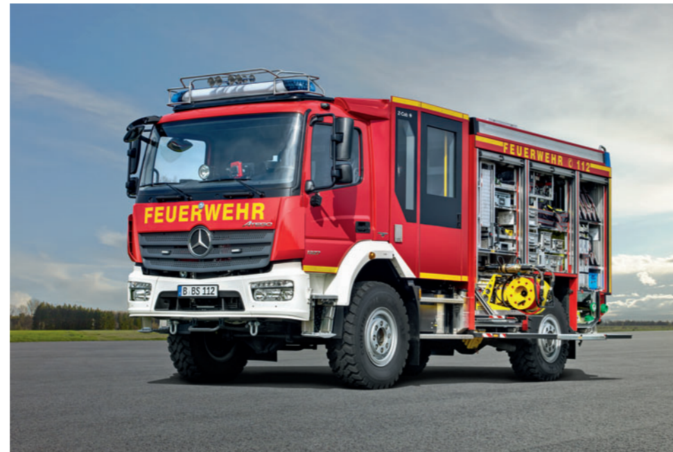
Atego 1327 AF 4x4, HLF 10

Verbrauch. Einsparungen beim Gewicht und optimierte Nebenverbraucher wie die neue Viskose-Lüfterkupplung helfen dabei, den Verbrauch noch weiter zu senken. Neben großer Leistung bei niedrigem Verbrauch sorgen die neuen Motoren auch für höhere Sicherheit. Die neue Motorbremse mit bis zu 235 kW kann optional durch ein Hochleistungsbremssystem mit 300 kW Bremsleistung ersetzt werden. Auf Wunsch ist zudem eine Kraftstoffvorwärmung erhältlich, die auch bei extrem niedrigen Temperaturen ständige Einsatzbereitschaft garantiert.