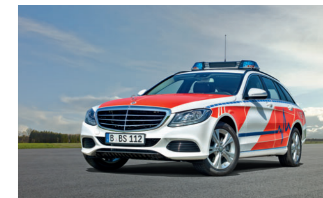
Die C-Klasse als KdoW