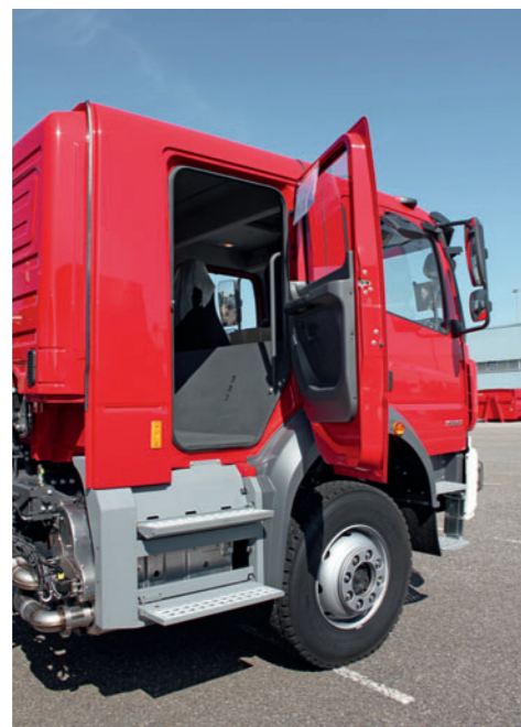
Ergonomischer Einstieg und automatisch klappbare Trittstufen

Mercedes-Benz Custom Tailored Trucks: Die beste Adresse für Umbauten an einem Mercedes-Benz LKW ist Mercedes-Benz selbst. Bei Mercedes-Benz Custom Tailored Trucks nutzen Spezialisten ihre jahrzehntelange Erfahrung im LKW-Bau und finden passgenaue Antworten auf jeden Kundenwunsch. Der Konstruktion geht eine genaue Analyse der Kundenbedürfnisse voraus. Gemeinsam mit dem Kunden wird die beste Basis für den Aufbau ermittelt, sorgfältig geplant und daraufhin angepasst. So sind in den letzten 15 Jahren bereits 150.000 kundenindividuelle Mercedes-Benz Trucks entstanden. Nähere Informationen erhalten Sie bei Ihrem Mercedes-Benz Sonderfahrzeugverkäufer.