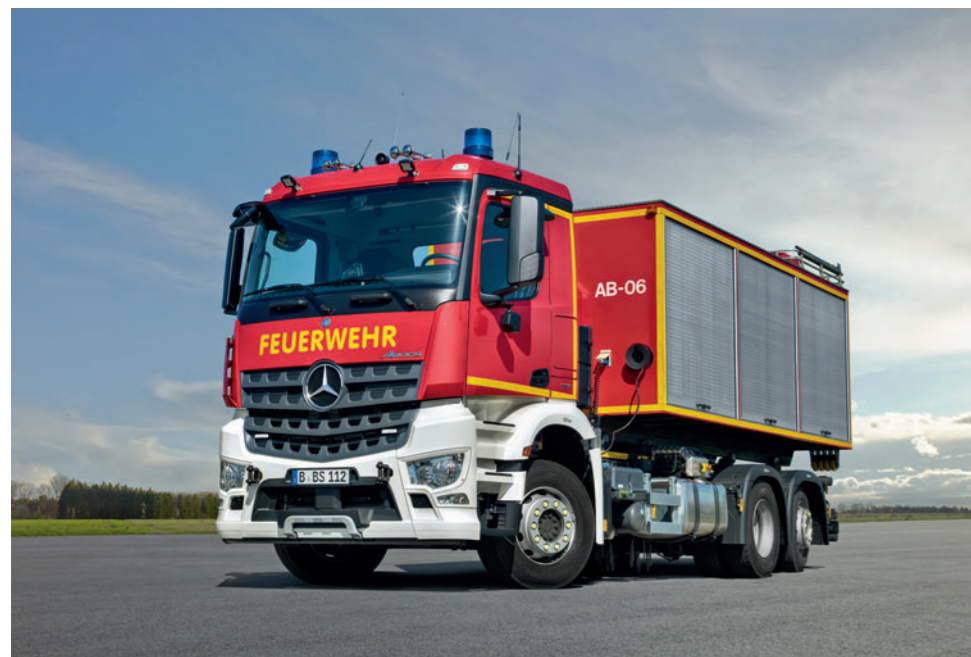
Arocs 2543 L 6x2, WLF

Einsatzort transportieren. Der Econic von Mercedes-Benz realisiert durch sein einzigartiges und serienmäßiges Niederrahmenkonzept einen besonders niedrigen Einstieg über nur eine Stufe. Zusammen mit dem geräumigen Fahrerhaus und der pneumatischen, vollverglasten Falttür auf der Beifahrerseite ermöglicht das Low-Entry-Konzept des Econic den Einsatzkräften einen bequemen und sicheren Ausstieg auch in voller Atemschutzausrüstung. Dies stellt einen unübertroffenen Sicherheitsaspekt im Einsatzgeschehen dar.