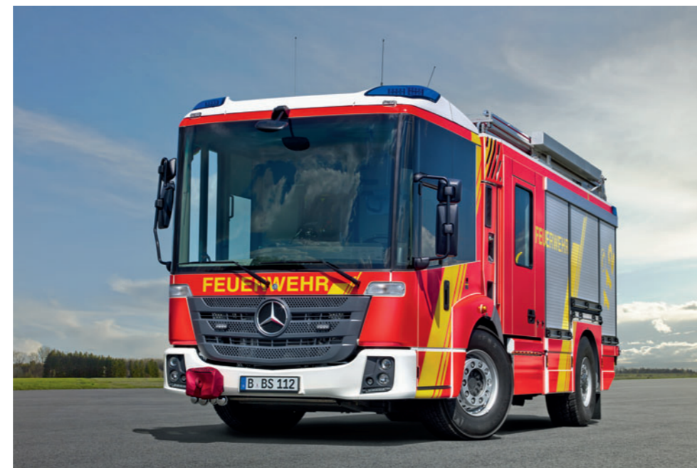
Econic 1830 4x2, HLF 20