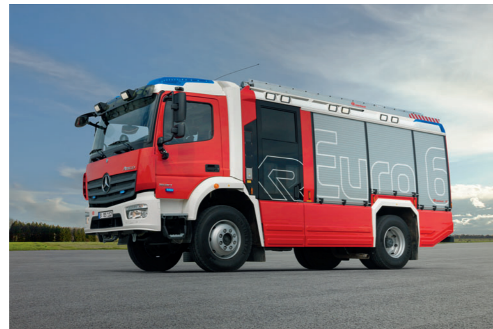
Atego 1530 AF 4x4, HLF 20

Fahrer bei der Einsatzfahrt entlastet. Dank optionalem Allradantrieb ist auch schwieriges Gelände kein Hindernis für Mercedes-Benz Fahrzeuge. Der Antrieb des Atego passt sich den Gegebenheiten an und bringt das Fahrzeug samt Mannschaft schnell und sicher an jeden Einsatzort. Darüber hinaus können die Tanklöschfahrzeuge auf Basis des Atego Wasserkapazitäten bis 4.000 Liter an den Einsatzort befördern.