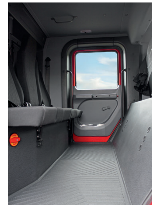
4 Einzelsitze mit 3-Punkt-Sicherheitsgurten

Ergonomischer Arbeitsplatz. Und geräumige Umkleidekabine. Im Einsatz ist die Fahrerkabine der Ort zur Vorbereitung. Um sich schnell auf jede Lage einzurichten, ohne dass die Konzentration verloren geht, ist die Doppelkabine des Mercedes-Benz Atego bestens geeignet. Durch eine zweite Sitzreihe mit vier zusätzlichen Einzelsitzen bietet die Kabine Platz für eine Staffelbesatzung. Verstellbare Rückenlehnen, 3-Punkt-Sicherheitsgurte und ein großer bequemer Einstieg sorgen für maximalen Komfort und Sicherheit. Durch die Platzierung der Abgasbox und des Kraftstofftanks unter dem Fahrerhaus kann der Bauraum des Chassis maximal für weitere Aufbauten genutzt werden. Das Zusatzgewicht der Doppelkabine liegt im Vergleich zur Einzelkabine bei nur 600 kg. Sie ist konform mit DIN EN 1846/2.