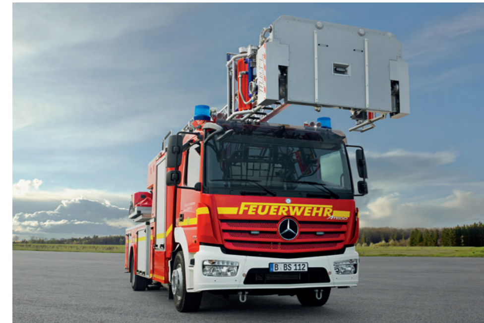
Atego 1530 F 4x2, DLA(K) 23/12

Bei Einsatzfahrten denkt niemand mehr an den Verbrauch. Außer Ihr Mercedes-Benz. Neue Motoren nach EURO VI-Norm verbrauchen bis zu 5% weniger als ihre Vorgänger, ohne dabei auf Leistung zu verzichten. Die neuen 4- und 6-Zylinder-Reihenmotoren im Atego liefern bis zu 220 kW Motorleistung und ein maximales Drehmoment von 1.200 Nm. Hoher Einspritzdruck von bis zu 2.400 bar sorgt für punktgenauen Durchzug in jeder Situation. Gleichzeitig steigert der hohe Druck die Effizienz der Kraftstoffverbrennung und senkt den