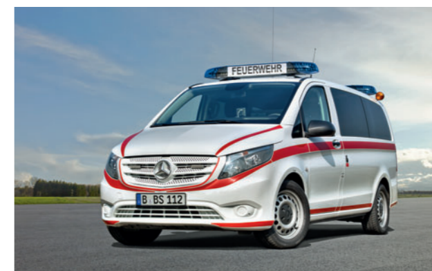
Der Vito als KdoW, MTW oder ELW