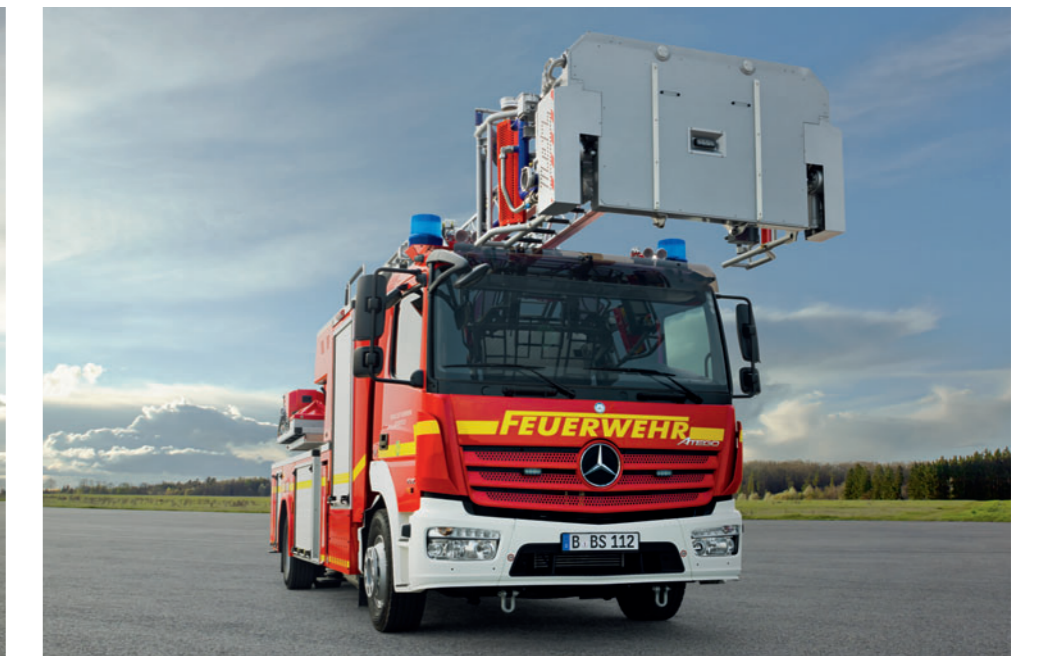
Atego 1530 F 4x2, DLA(K) 23/12