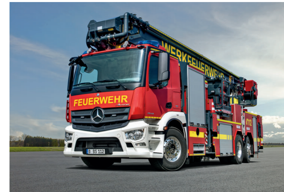
Antos 2543 L 4x2, HRB

fahrzeuge von Mercedes-Benz die Helfer in bis zu 60 Meter Höhe. Und um auch in engen Straßengassen schnell und sicher zum Einsatzort zu kommen, sind die Fahrzeuge besonders wendig und bieten dem Fahrer einen übersichtlichen Arbeitsplatz.